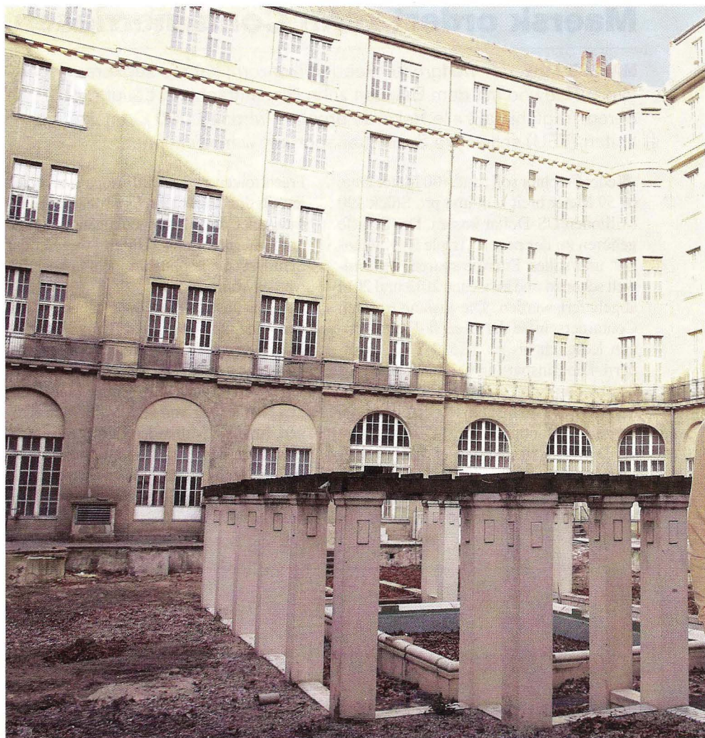
Dirk Germandi, Profi Partner, plant im hinteren Teil des Cumberland Hauses 200 Wohnungen.

In gewisser Weise steht das Haus Cumberland für einen Trend im Markt für Denk-